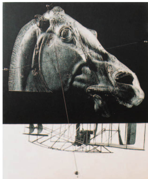
北川健次 「ローマにおける僅かセブミリの受難」