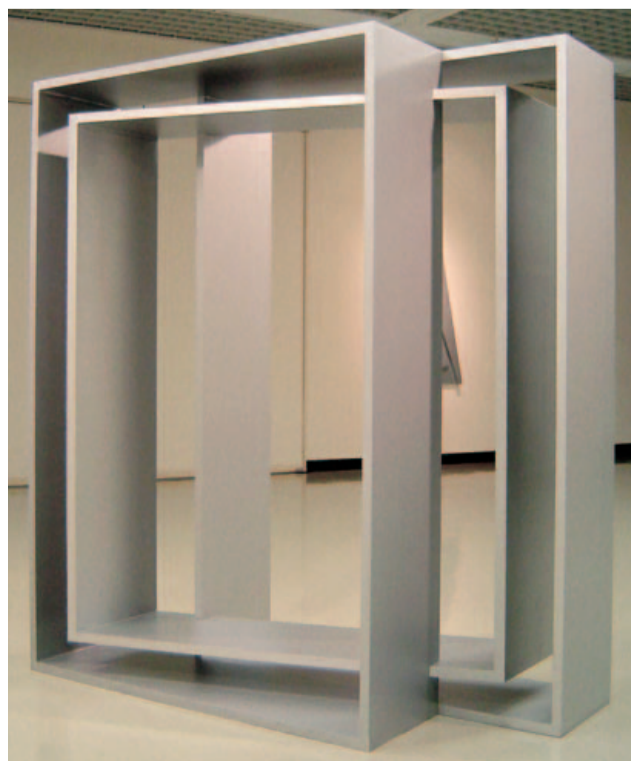
長谷光城 「箱体<匿名>NO.2」