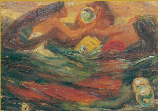
下左から ◎青木繁「運命」1904年 東京国立近代美術館蔵 ◎浅井忠「編みもの」1901年 京都国立近代美術館蔵 ◎黒田清輝「落葉」1891年 東京国立近代美術館蔵