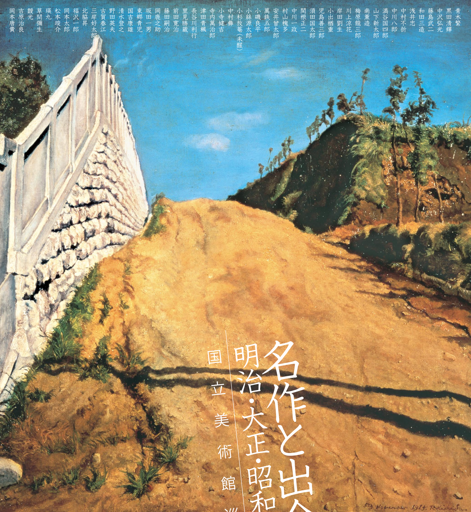
岸田劉生「道路と土手と堀(切通之写生)」1915年 重要文化財 東京国立近代美術館蔵