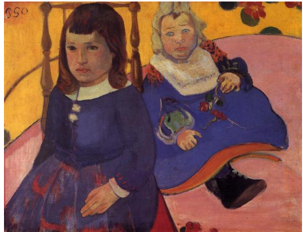
右：ポール・ゴーギャン《2人の子供》1889年頃 油彩 ニイ・カールスベルグ・グリプトテク美術館 Ny Carlsberg Glyptotek, Copenhagen