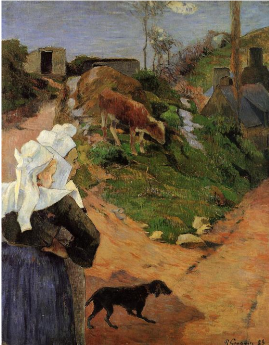
左：ポール・ゴーギャン《2人のブルターニュ女性のいる風景》1888年 油彩 ニイ・カールスベルグ・グリプトテク美術館 Ny Carlsberg Glyptotek, Copenhagen