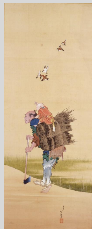
葛飾北斎「杣人春秋山水図」