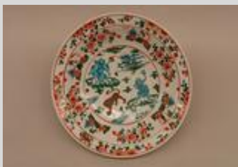
中国・明時代「五彩羅漢文盤」