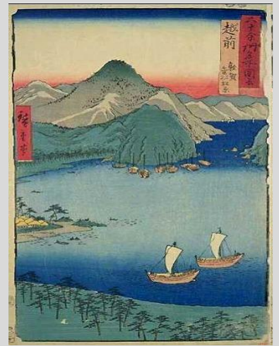
歌川広重 (初代) 「六十余州名所図絵 越前 敦賀気比ノ松原」