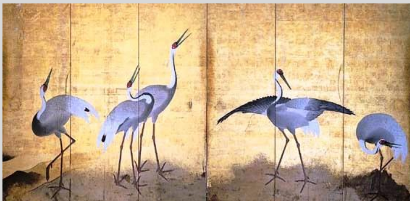
岩佐源兵衛「群鶴図」：福井城本丸御殿の一室「鶴の間」襖絵 (伝)