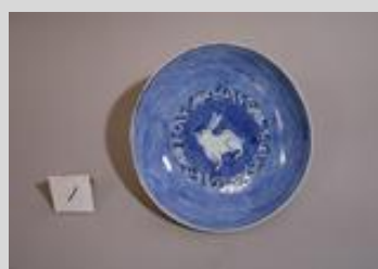
中国・明時代「青花兔文皿」