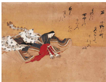
岩佐又兵衛 「三十六歌仙図 小野小町」