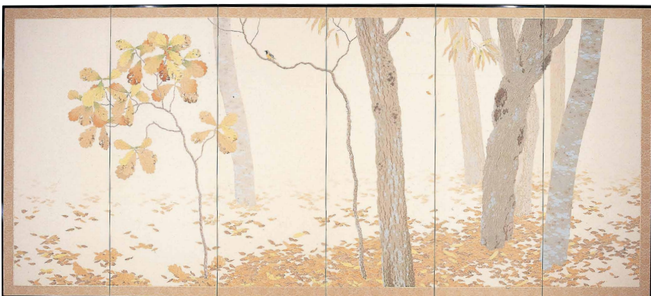
菱田春草「落葉」(右隻)