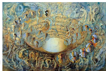
宇佐美圭司 「円形劇場・底抜け」