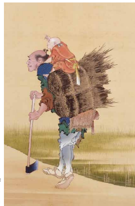
葛飾北斎 「袖人春秋山水図」(肉筆) 中幅(部分)