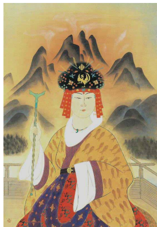
安田毅彦「卑弥呼」滋賀県立近代美術館