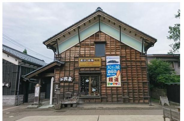
二階蔵（左手が平蔵）