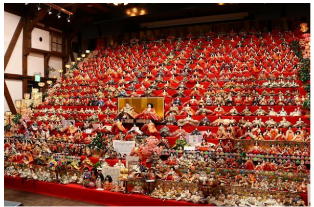
ひなまつりの様子