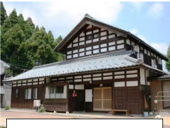
ふくいの伝統的民家