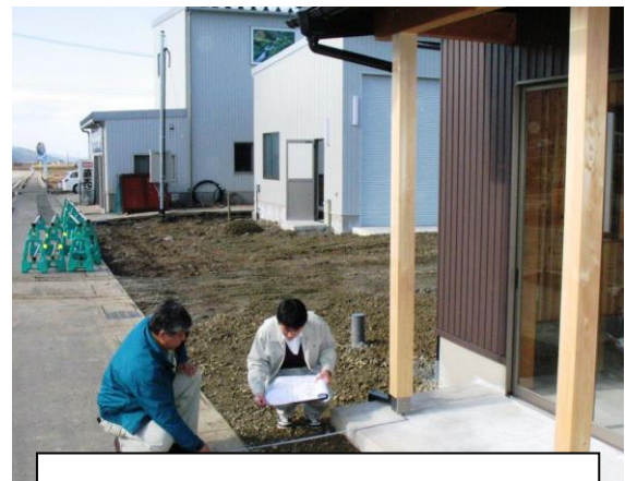
建築物の完了後の検査