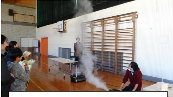
住教育 …対流式暖房について学ぶ