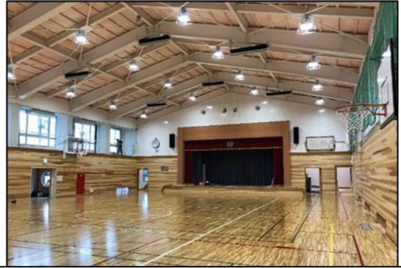
嶺南東特別支援学校(体育館)改修