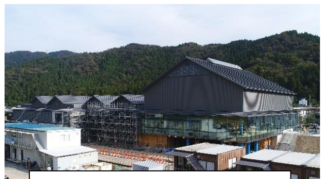
一乗谷朝倉氏遺跡博物館（仮称）