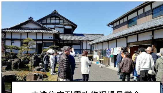
木造住宅耐震改修現場見学会