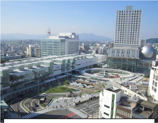
福井駅西口中央地区再開発事業