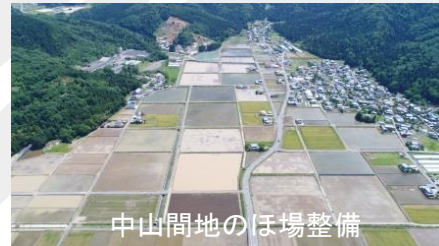
中山間地のほ場整備

A.現在の仕事は、自分一人ではできないことが多くあります。そこで職場の上司や同僚、関係する農家の方と協力しながら、一つの仕事を成し遂げたときには大きなやりがいを感じます。