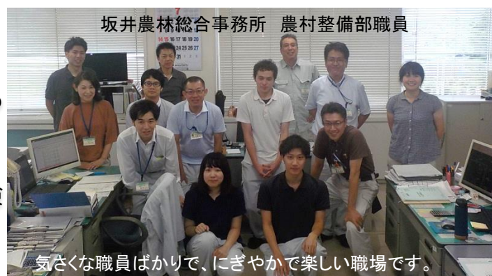
坂井農林総合事務所 農村整備部職員