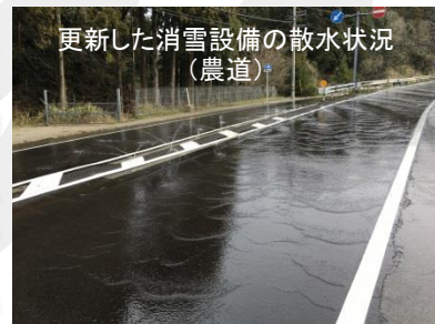
更新した消雪設備の散水状況（農道）

どんな構造物も永久的なものはありません。経年劣化により、舗装が割れて事故の原因となったり、ポンプ場が上手く機能せず田んぼが水に浸かる原因となったりします。そのため定期的な補修が必要となります。技術が日々進歩しているように、前あったものよりもさらに良いものを作るため、毎日勉強しながら工事を進めています。農業土木の世界がこの世の全てかと思うような、幅広い知識が必要です。とても楽しいですよ。