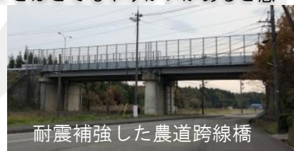
耐震補強した農道跨線橋

また、農業土木職員は調査から工事の完了まで、一連の業務を担当し、その後の管理にも関わることから、多種多様な技術を学ぶことができるのも農業土木の魅力の一つだと感じています。