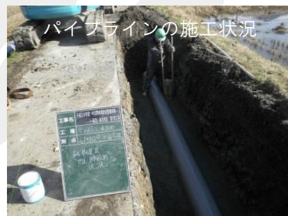
パイプラインの施工状況

職場の環境は、それぞれ特色があるとは思いますが、私が所属している二州農林部は、困ったときにはすぐ相談でき、和やかな雰囲気のある職場です。また、ソフトボール大会や水土里ウォーク福井というウォークイベントもあり、公私ともに充実した生活が送れると思います。農業土木職に興味を持たれた皆さん、農業振興に役立つ仕事を一緒に進めていきましょう！