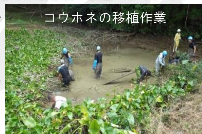
コウホネの移植作業

既存の環境への影響や動植物に配慮しつつ、改修したため池が今後も長く営農に活用されるよう意識しながら、整備を進めています。